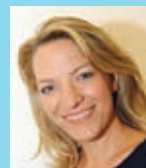
Kulturphänomene Conti-Foyer Eintritt 8/5 €