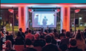
Kulturphänomene Conti-Foyer Eintritt 10/6 €