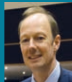
Kulturphänomene Conti-Foyer Eintritt 10/6 €