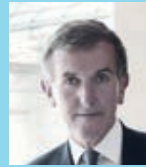
Kulturphänomene Conti-Foyer Eintritt 10/6 €