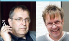
Kultur:Wissenschaft Conti-Foyer Eintritt 8/5 €