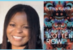
Atlas der Literaturen Conti-Foyer Eintritt 10/6 €